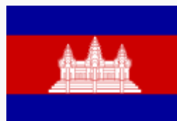
(Drapeau du Cambodge)