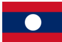
(Drapeau du Laos)

République démocratique populaire lao / Laos